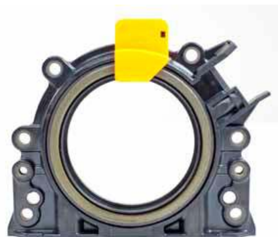
Ilustracja 2_Zintegrowany pierścień uszczelniający wał

VICTOR REINZ - la scelta migliore per guarnizioni di ottima qualità.